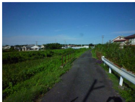
9月15日 湯日川千種橋付近